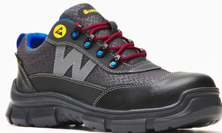
Antiestático / Dieléctrico