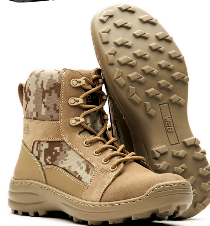
Tactical & Outdoor